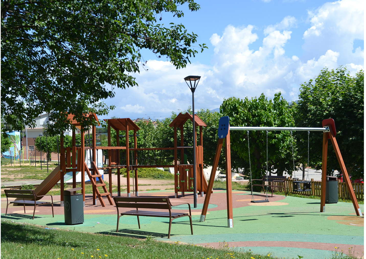
MADERA 2 planos JL1520000

En Sant Hipòlit de Voltregà, Barcelona, un parque infantil completo espera a los más pequeños. Equipado con juegos, luminarias y mobiliario urbano Benito, es el lugar ideal para la diversión y el encuentro familiar.