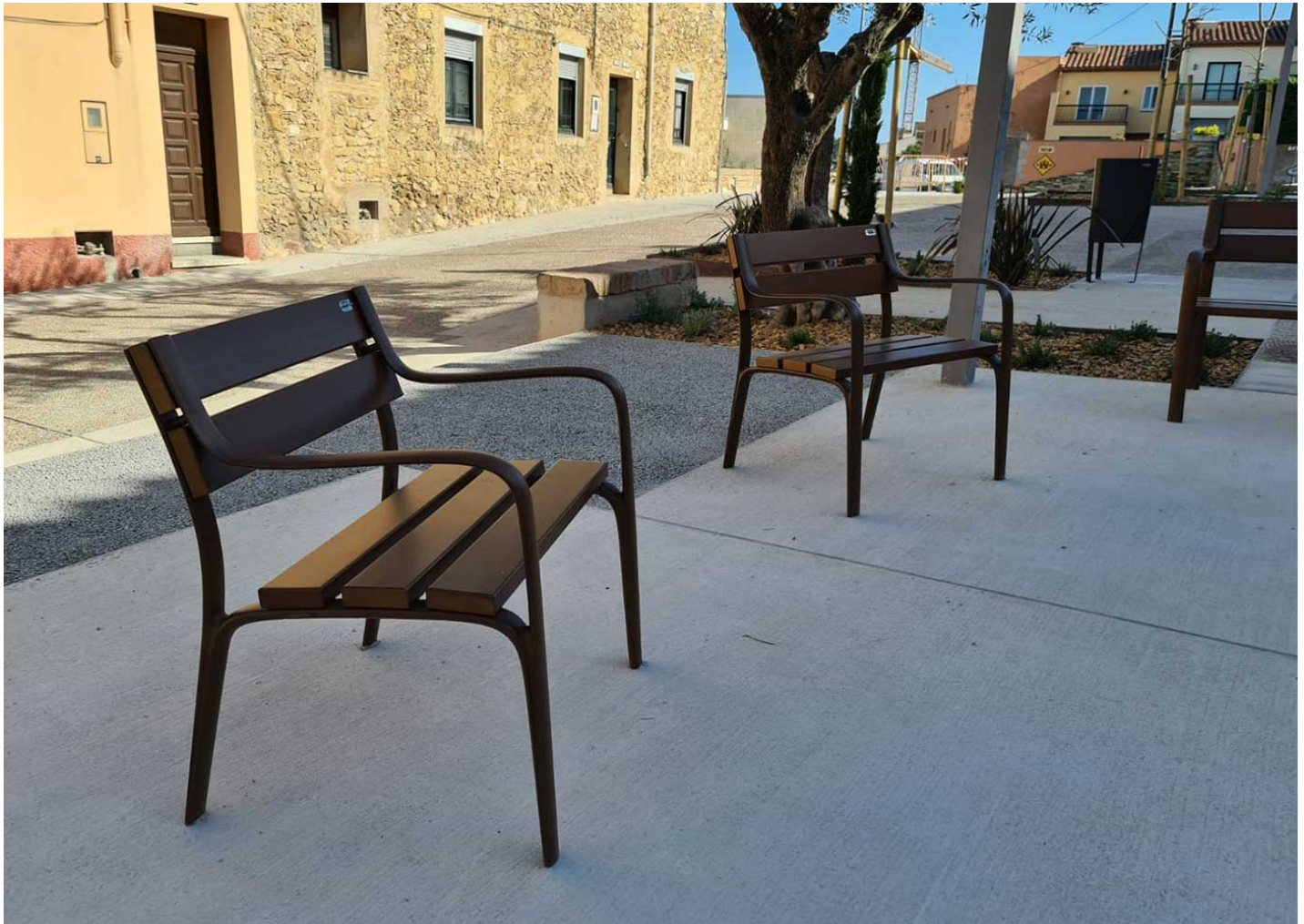
Argo 80 PA613

Instalación de bancos y sillas Citizen de madera y fundición en el municipio de Llers en la provincia de Gerona.