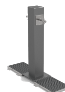
Atlas Doble UM511-2M