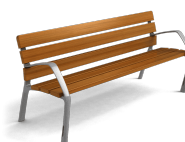
NeoBarcino ReBnew UM304NPRH